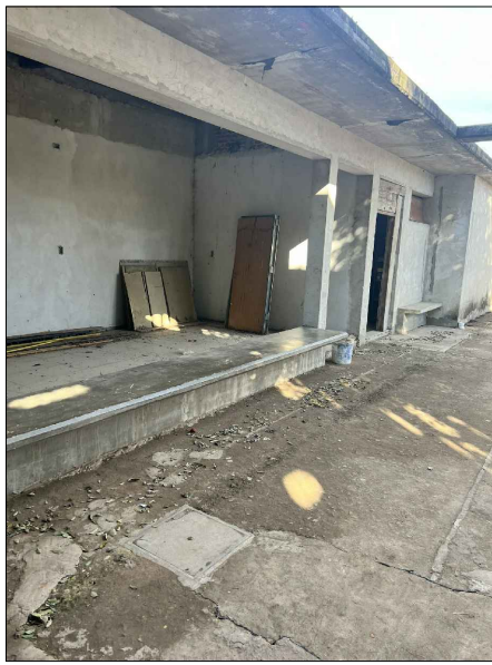
02 - DEMOLICION CONTRAPISO (GALERÍA SUR)