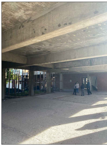
02 - DEMOLICION CONTRAPISO (SUM)