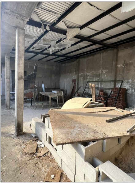
04 - EXTRACCIÓN AISLACIÓN ISOLAM BAJO CUBIERTA (AULA CONSTR.)